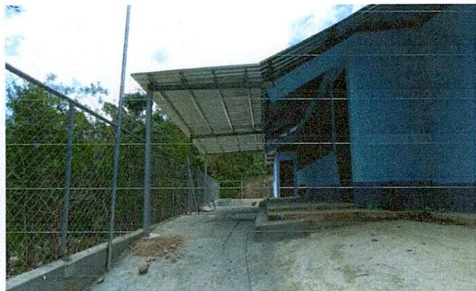
Foto 3: Estructura de costaneras techado lámina y sus canales e instalación de energia y luminación